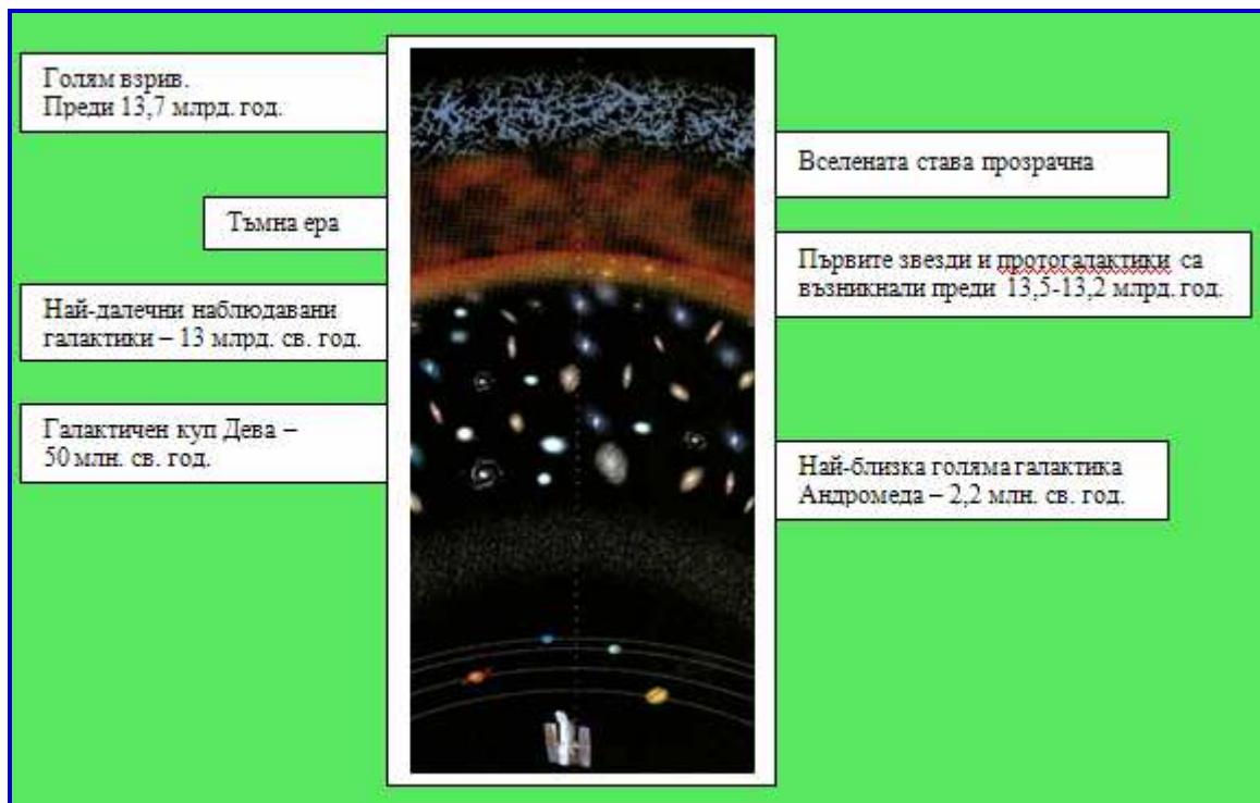
Фиг.3 Большой взрыв по последним данным должен был совершиться 13,7 млрд. лет тому назад. Космический телескоп “Хаббл” позволяет нам достичь почти “границы” Вселенной.

Но почему никто из нас не может с уверенностью сказать, что видел промежуточные этапы “проклевывания” звезд, даже когда рассматривается вся доступная для наблюдения часть Вселенной? Чем дальше отстоят от нас галактики, тем в более далекие эпохи происходили наблюдаемые нами процессы. Если принять, что самые далекие наблюдаемые объекты находятся на расстоянии 13 млрд. ly, это значит, что в определенном смысле можно проследить все эпохи развития Метагалактики за этот период времени (фиг. 3)[15]. Так что мы могли бы стать свидетелями зарождения звезд, если бы оно происходило даже в очень далеком прошлом. Но где на небе это огромное количество протозвезд?!